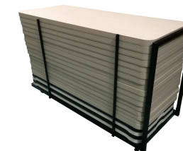
Chariot de tables Réf CHTAB