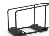
Chariot de tables Réf 80339