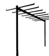
Partie haute Réf CHCHARE