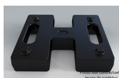
Photo non contractuelle Image de synthèse