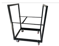
Chariot de Tables Réf CHMD