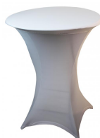
Nappage Réf NAPCOCKTAIL-BLANC