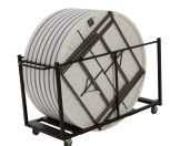
Chariot de Tables Réf 80193