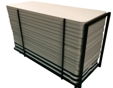
Chariot de tables Réf CHTAB