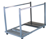
Chariot de Tables Réf 6520