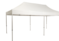
Toit Polyester 300gr/m2 enduit PVC Réf R300-6