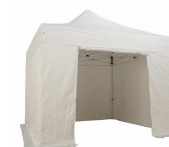
Kit 4 murs (1 mur porte et 3 pleins) 300gr/m2 polyester enduit PVC Réf GAACW-6