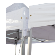
Gouttières 6m Réf GALHG-6