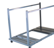
Chariot de Tables Réf 6520