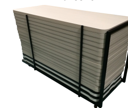
Chariot de Tables Réf CHTAB