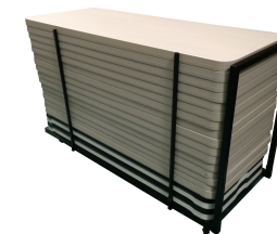
Chariot de Tables Réf CHTAB