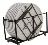
Chariot de Table Réf 80193