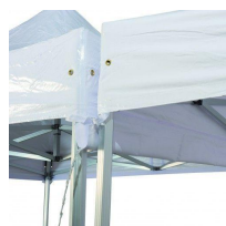
Gouttières 6m Réf GALHG-6