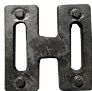
Poids de lestage en fonte d'acier de 15-30kg Réf GAP-15