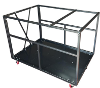
Chariot de Tables Réf CHALLIN1