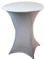
Nappage Réf NAPCOCKTAIL-BLANC