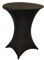
Nappage Réf NAPCOCKTAIL-NOIR