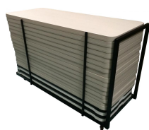
Chariot de Tables Réf CHTAB