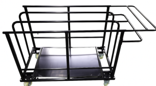
Chariot de tables Réf CHTABRO