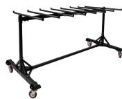
Chariot de chaises Réf CHCHA