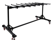
Chariot de chaises Réf CHCHA