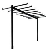
Réhausse chariot de chaises Réf CHCHARE