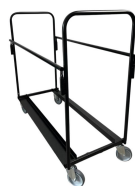
Chariot de chaises Réf CHAIRCART