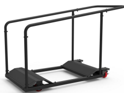
Chariot de Tables Réf 80339