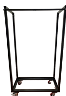
Chariot de chaises Réf CHJETFUR