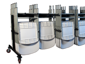
Chariot de Chaises Réf CHCHA