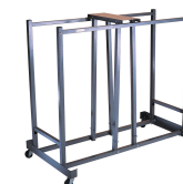
Chariot de Chaises Réf 6525