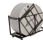
Chariot de Tables Réf 80193