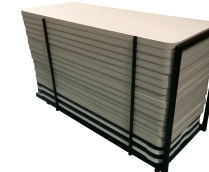
Chariot de Tables Réf CHTAB